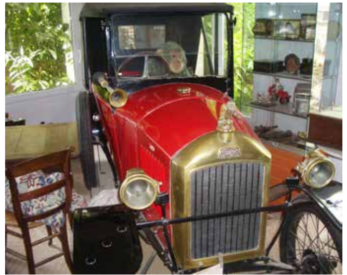
Quadrilette-Mekka i nærheden af Avignon, hvor en mand havde 16 stk.

var udstyret til classic race. Da jeg spurgte til den sekstende, viste han vej ind i dagligstuen, og her stod så den, der var mage til min. Hans gamle mor sad i en lænestol ved siden af bilen. I træskuret var der tillige masser af reservedele, men bare ikke de stumper, som jeg manglede. Det er vist en kendt erfaring, at det er de samme dele, der går i stykker på de samme modeller.