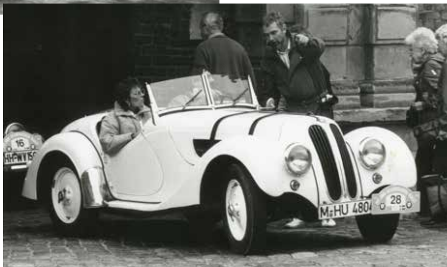
Tekst og fotos: Peter Bering.