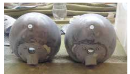
Restaureringen er i gang – her ses den færdige motor og chassisrammen i 2013. Længst til højre karrosseriet og lygterne fotograferet hos maleren i 2014.