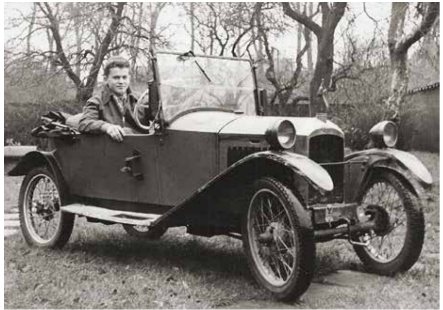
Den allerførste tur...