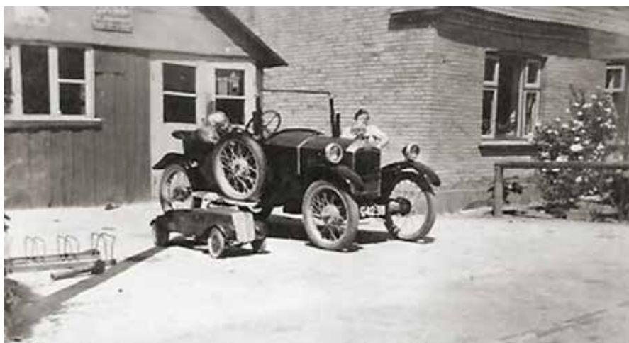
Foto fra 1953; nu er det cykelsmed Boeriis, der ejer bilen. Der er kommet afviservinger på.