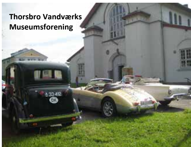
Thorsbro Vandværks Museumsforening