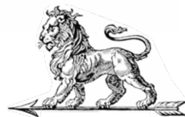
Illustration: Frank Studstrup