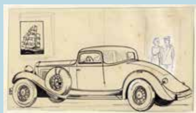
Høyrups tegning af Reo