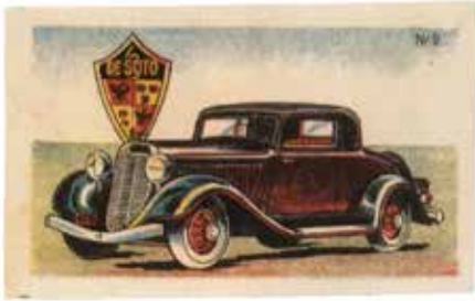
Her nøjes vi med at gengive tegningen af nr. 9, De Soto. Mon ikke der er Høyrup, der er ophavsmand?

På internettet findes Kudahls regi-strant på linket www.samlebilleder.dk og heraf fremgår: