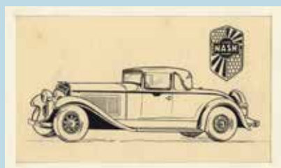
Høyrup-tegning af en Nash

Det ser ud til at være mere end sandsynligt, at Høyrups tegninger blev brugt til dette formål. Se også tegningen af Nash – helt samme streg. Tegningen af Reo'en på samlebillede nr. 30 er dog ikke den samme som den ovenfor. Kan den være lavet af en anden tegner, men ud fra samme forlæg?