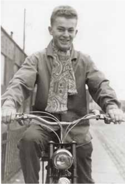
På Wooler 1954

Da jeg jo ikke var gammel nok til at erhverve kørekort, måtte jeg have nogle kammerater, som var fyldt 18 år og havde kørekort, til at køre for mig.