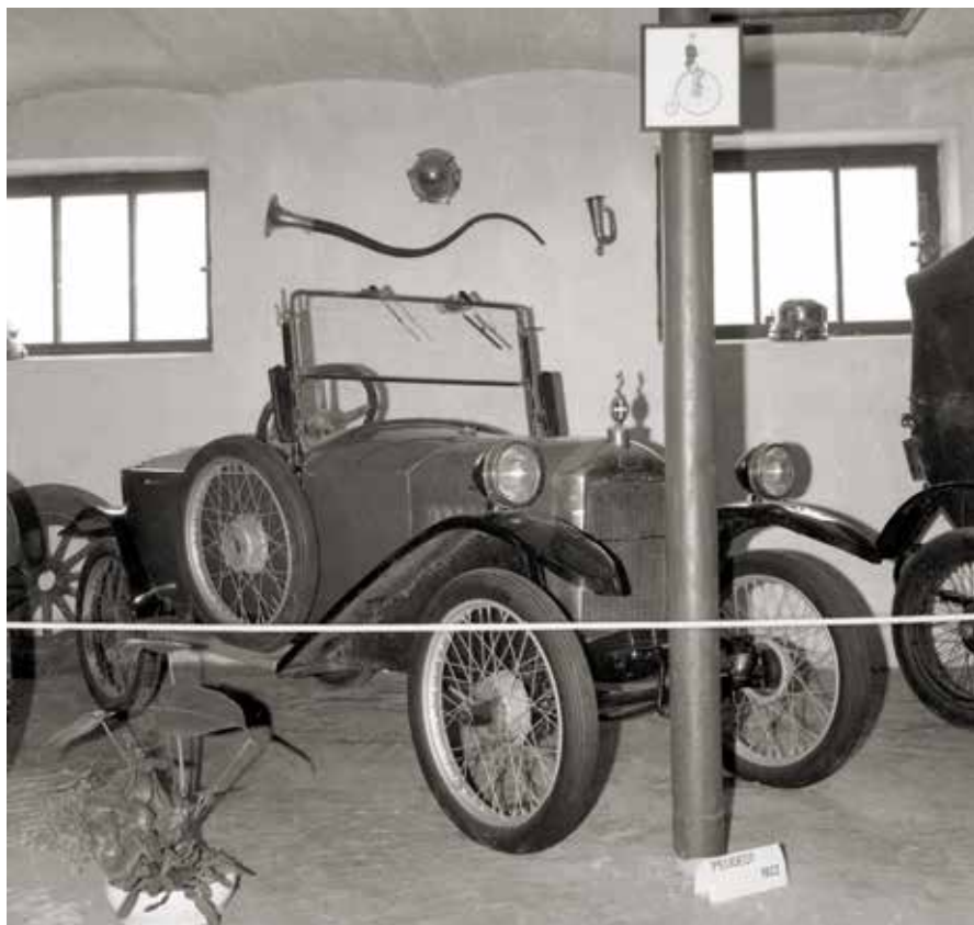
Et billede fra midten af 60'erne, hvor bilen var udstillet på Pedershvile