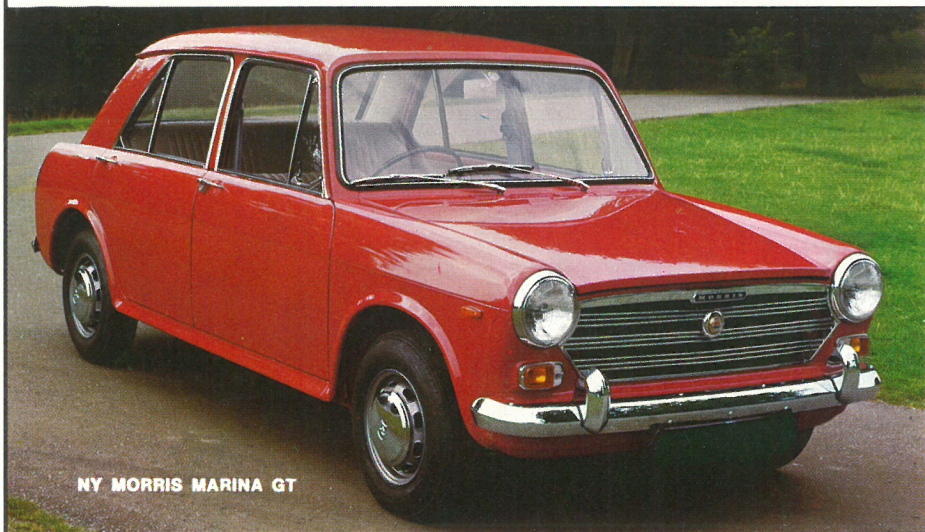
NY MORRIS MARINA GT

Den raffinerede Morris Marina med de overlegne køreegenskaber kommer til april som GT-model med 1,3 liter motor, større bremses, fastback og nyt interiør med mange lækre detaljer - og rykker dermed op i klassen, hvor krævende GT-kørere søger deres biler - og til excl. lev. ca. kr. 22.000,-