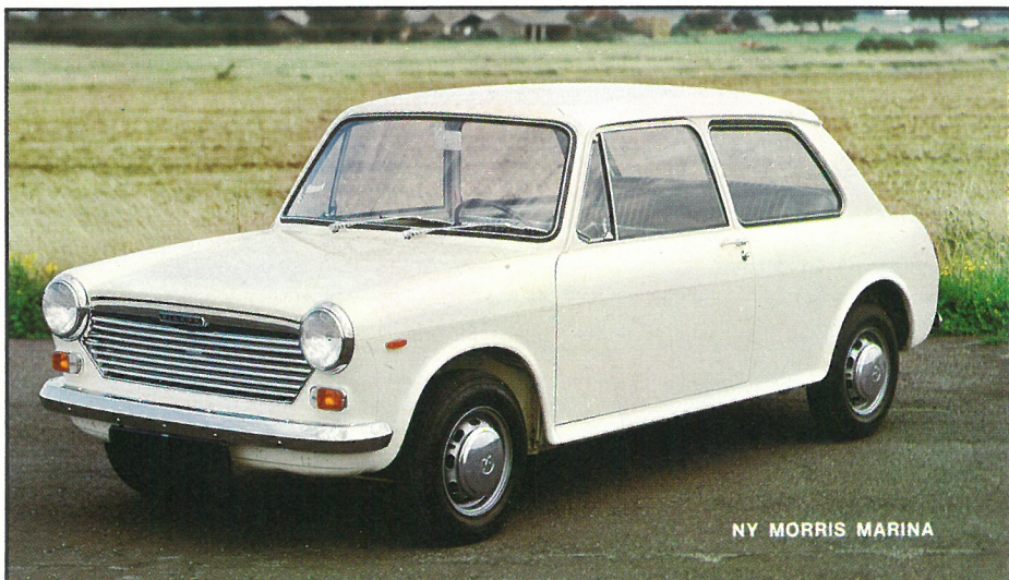
NY MORRIS MARINA

Set udefra er kendetegnene på den ny Morris Marina: fastback, ny grill og moderne ventilerede hjul - og inde: lækrere indtræk og nyt, centralt monteret instrumentbord. Resten af bilen, inclusive komforten og de fremragende køreegenskaber, er som før! Pris excl. lev. kr. 19.990,-