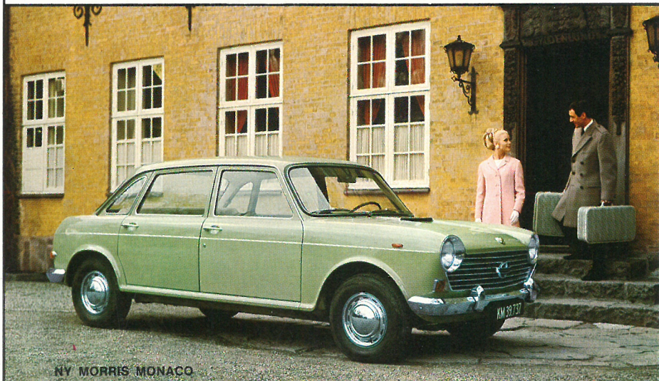
NY MORRIS MONACO

Køreteknisk er kun én ting ændret ved den nye Morris Monaco: Den har fået ny knastaksel, der giver bedre acceleration. Ellers er det interiøret, der er nyt - med forsæder af bucket-typen, armlæn på alle døre, midterarm læn på bagsæde - og nyt instrumentbord. Pris excl. lev. kr. 29.394,-