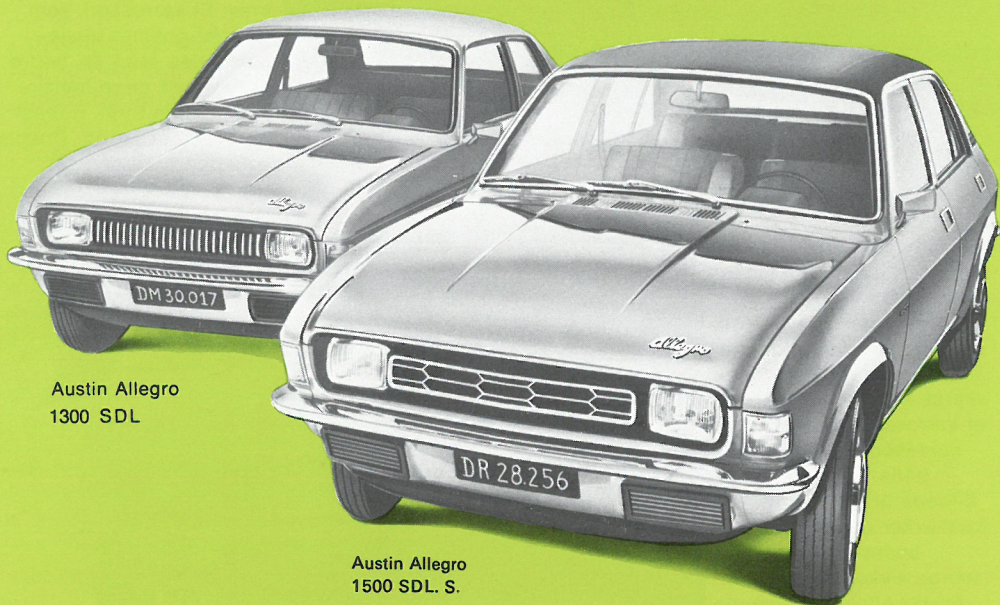
Austin Allegro 1300 SDL