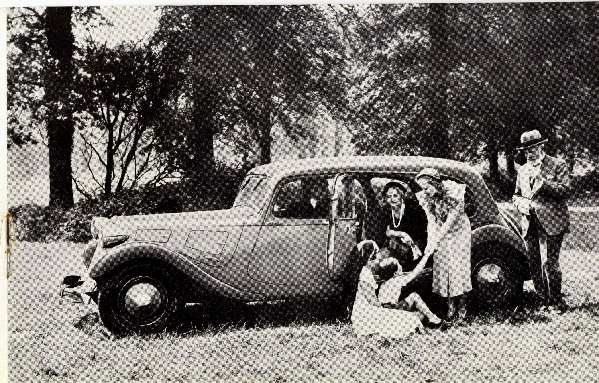
Citroën Sedan "11", 6 Personer og Familiale "11", 7 Personer

Citroën-Ejerne ved, at deres Vogn stadig er „2 AAR forud“