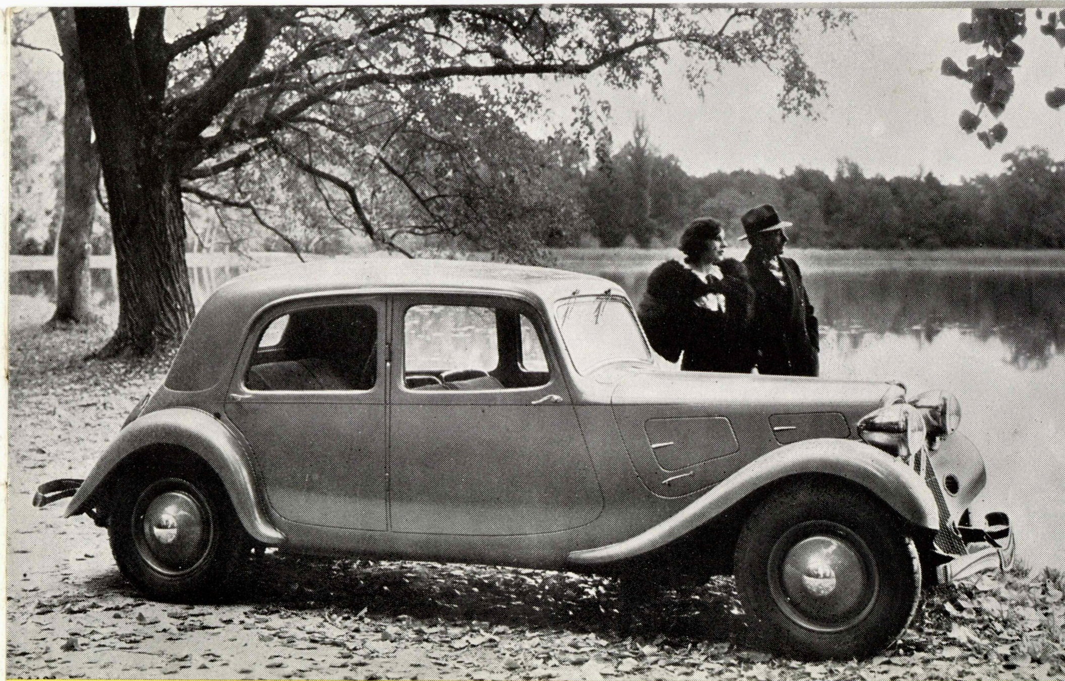
Citroën Berline "7" og Berline "11 Sport", 5 Personer,

De har maaske kørt Bil i mange Aar, men kender De den Sikkerhedsfølelse, som en Køretur under vanskelige Forhold i den nye Citroën frembyder? Prøv det!